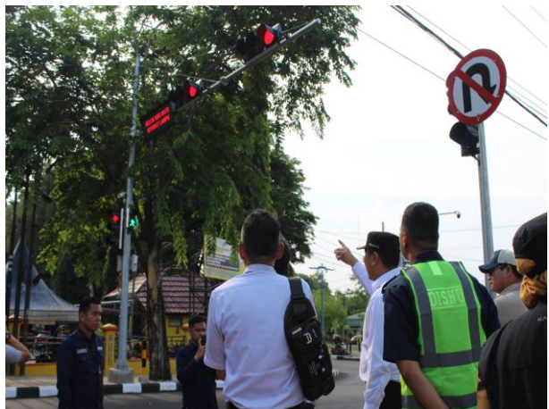
Belanja Modal Rambu Bersuar Jl. A. Yani Simpang Taman Van Deer Pijl Kelurahan Komet Kecamatan Banjarbaru Utara