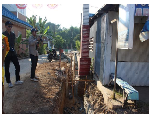
Pembangunan Drainase Lingkungan Jl. Sungai Salak Kelurahan Guntung Manggis Kecamatan Landasan Ulin Kota Banjarbaru