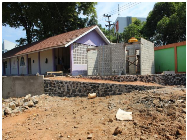
Rehabilitasi Kolam Renang Idaman Kota Banjarbaru Jl. Sarikaya Kelurahan Guntung Paikat Kecamatan Banjarbaru Utara Kota Banjarbaru