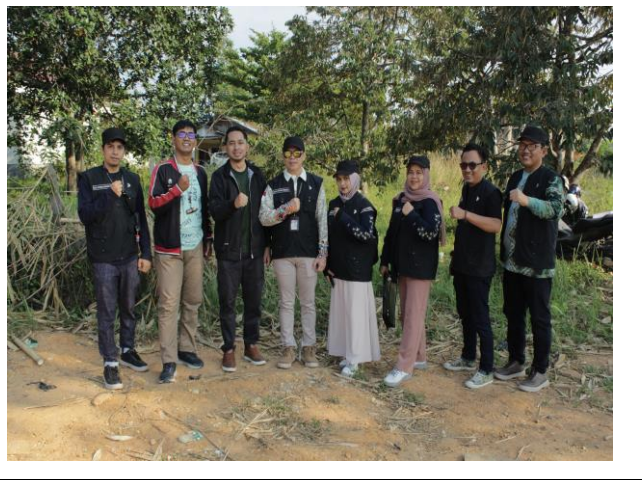
Peningkatan Sungai Kuranji Jl. Cempaka Baru Kelurahan Cempaka Kecamatan Cempaka Kota Banjarbaru