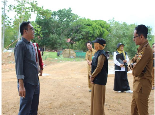
Pembangunan Pool Armada Jl. Gotong Royong Kelurahan Loktabat Selatan Kecamatan Banjarbaru Selatan