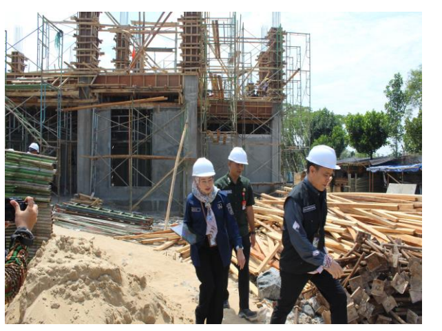
Pembangunan Gedung Kantor Dinas Perhubungan Kota Banjarbaru Jl. Palam Kelurahan Guntung Manggis Kecamatan Landasan Ulin Kota Banjarbaru