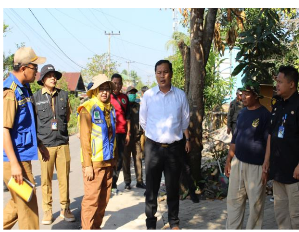
Pembangunan Drainase Lingkungan Jl. Bersama Kelurahan Landasan Ulin Selatan Kecamatan Liang Anggang Kota Banjarbaru