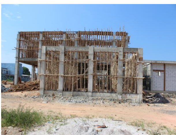
Pembangunan Bangunan Kesehatan (Puskesmas Banjarbaru Selatan) Jl. Lanan Kelurahan Kemuning Kecamatan Banjarbaru Selatan Kota Banjarbaru