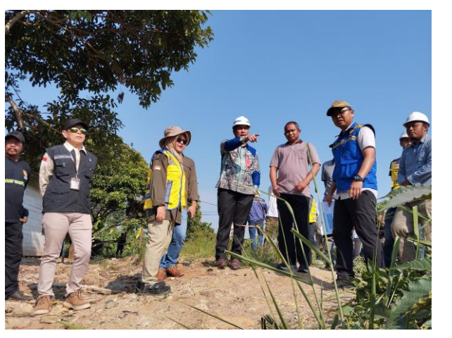
Peningkatan Sungai Kemuning Jl. Almanar Kelurahan Loktabat Utara Kecamatan Banjarbaru Utara Kota Banjarbaru