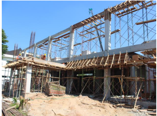
Pembangunan Gedung Kantor Dinas Kependudukan dan Pencatatan Sipil (Disdukcapil) Kota Banjarbaru