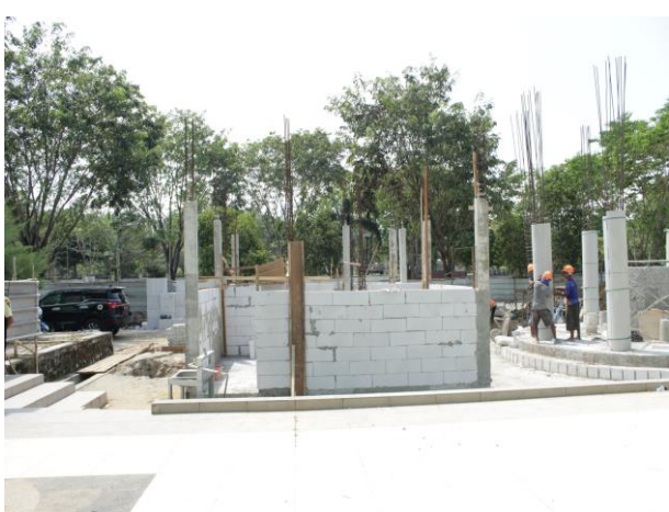
Renovasi Masjid Agung Al Munawwarah Kota Banjarbaru Jl. Trikora Kelurahan Kemuning Kecamatan Banjarbaru Selatan