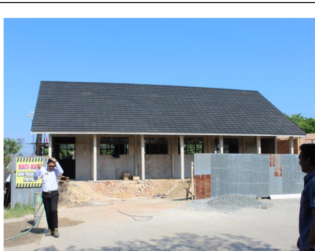
Penambahan Ruang Kelas SDN 5 Syamsudin Noor Jl. Komplek Wella Mandiri Kelurahan Syamsudin Noor Kecamatan Landasan Ulin